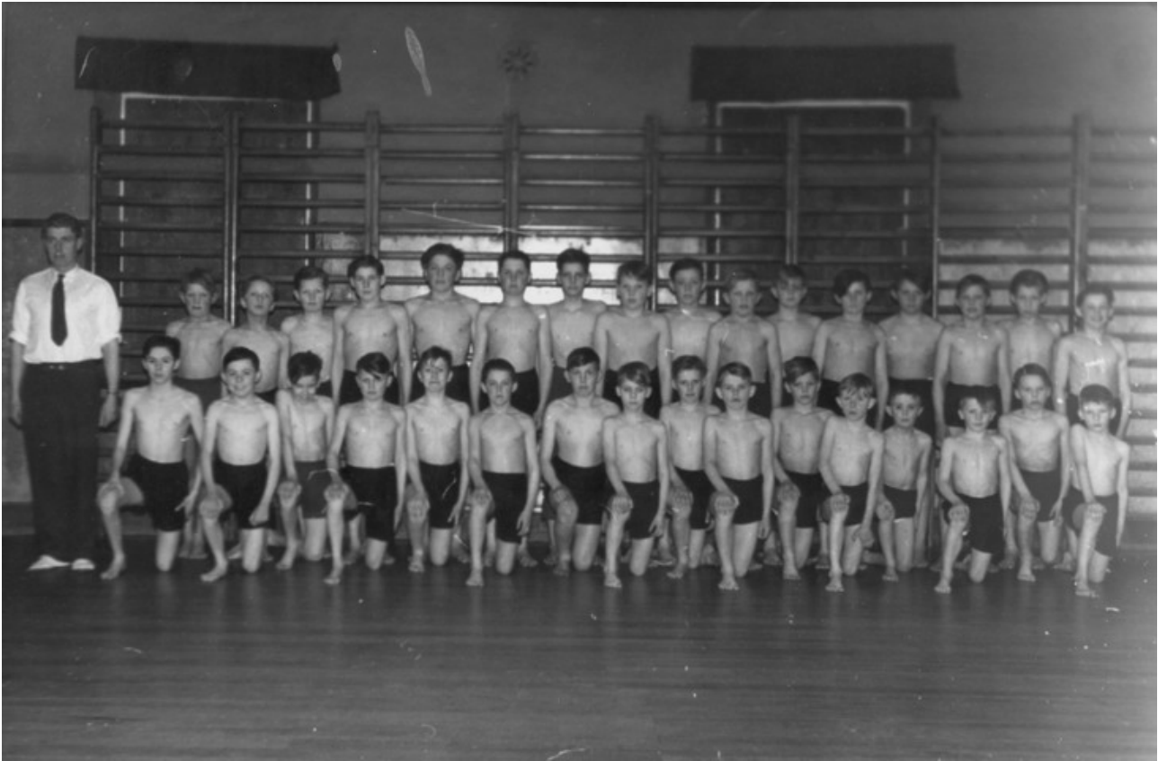
Gymnastik i Tappernøje Forsamlingshus.