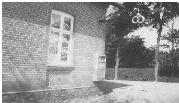
Hjørnet af Forsamlingshuset-

Ca. 1912 Udskrifter af tingbogs, tinglysning